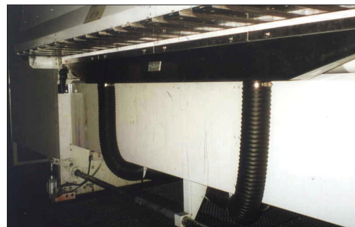
Göpfert Evolution 2800 mm: Zyklon mit 7,5 kW-Gebläse auf einem fahrbaren Podest (l.). Auf der rechten Seite: Saugkopf zwischen dem ersten Druckwerk und dem Anleger.

trachtung eines Einsatzbeispiels macht dies deutlich. Produziert wird mit einer Flexodruckmaschine von Göpfert , der Evolution RFP 16/28 VT-L , für die Fertigung von Displays und Verkaufsverpackungen aus Wellpappe mit einer Materialstärke von 0,6 bis 7,2 mm.